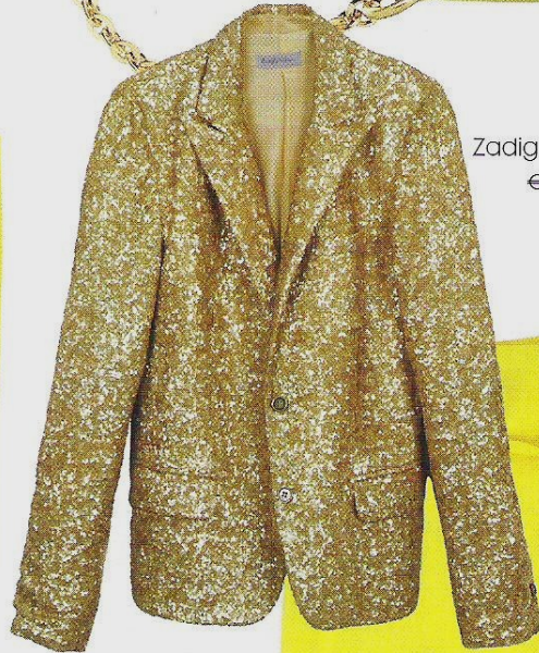
Zadig & Voltaire, € 360.