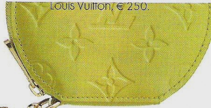
Louis Vuitton, € 250.