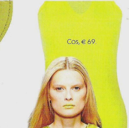
Cos, € 69.