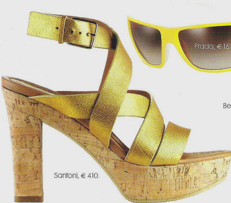
Santoni, € 410.

Veel kanariekleur op en naast de catwalk, goed voor een zonnige zomer!