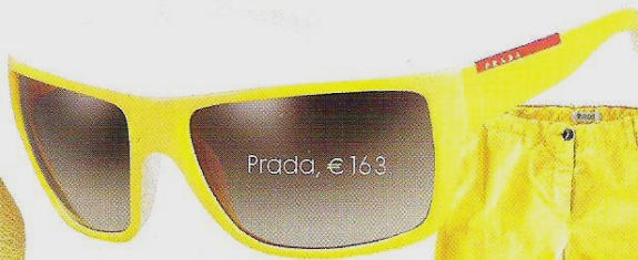
Prada, € 163