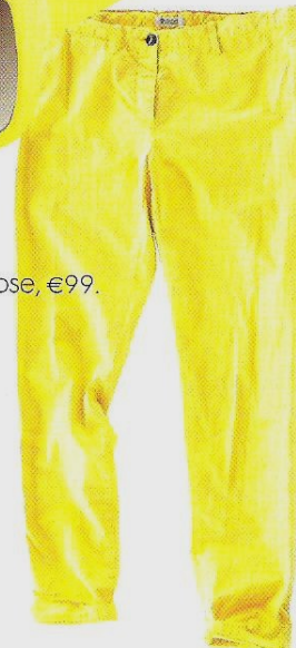
Bellerose, € 99.